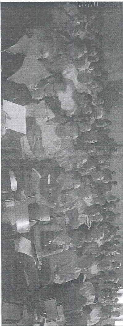
Les organisateurs se sont adressés à un nombre public.